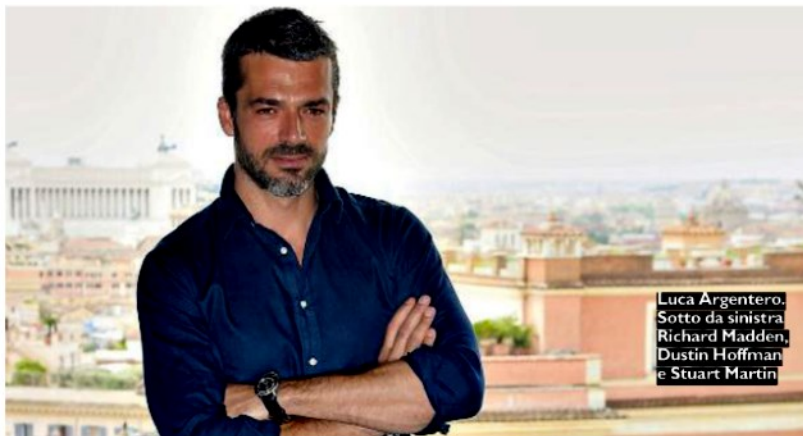
Luca Argentero. Sotto da sinistra Richard Madden, Dustin Hoffman e Stuart Martin